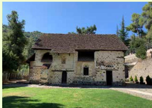
Chiesa di San Nicola

Visita della chiesa di San Nicola, una delle chiese meglio affrescate di Cipro.