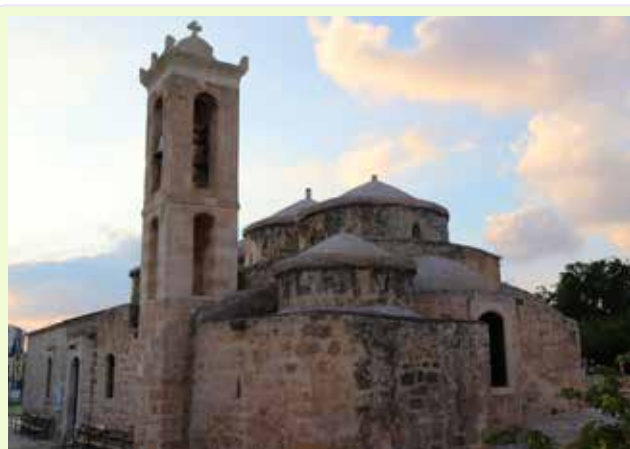
Paphos - Agia Paraskevi

Partenza verso la zona montuosa centrale, per il villaggio di Pedoulas dove visiteremo la chiesa affrescata dell'Arcangelo Michele, eretta nel 1474.