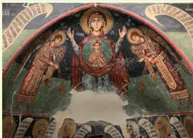
Pedoulas - Affreschi chiesa Arcangelo Michele

Arrivo a Paphos e visita della chiesa della Agia Kyriaki Chrysopolitissa, costruita nel XII secolo sopra le rovine della più grande basilica del primo periodo bizantino dell'isola; all'interno del complesso si può ammirare la colonna di San Paolo dove secondo la tradizione, San Paolo venne flagellato prima che il governatore romano Sergio Paolo si convertisse al Cristianesimo.