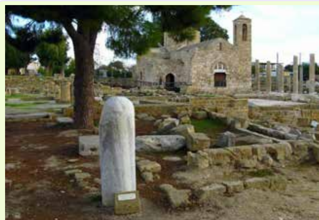
Paphos - Colonna di San Paolo

Primo stop a Curium, importante città-stato, oggi considerata uno dei luoghi archeologici più spettacolari dell'isola; visita dell'anfiteatro greco-romano e della casa di Eustolio, in origine villa romana privata, successivamente, durante il primo periodo cristiano, centro pubblico per le attività ricreative. Si prosegue per Petra tou Romiou, sulla spiaggia, luogo di nascita di Venere e per la chiesa di Agia Paraskevi, una delle più belle chiese Ciproite del XV secolo, sormontata da cinque cupole che formano una croce e che al suo interno custodisce dei bellissimi affreschi.